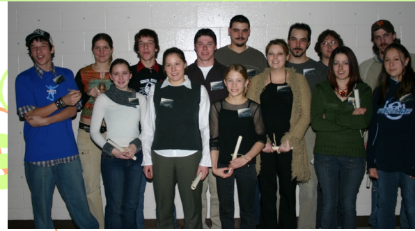
Gala Jeunesse 2005